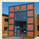
Médiathèque du Port-Marly